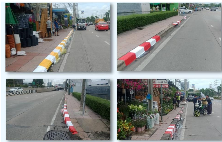
หลังดำเนินการ