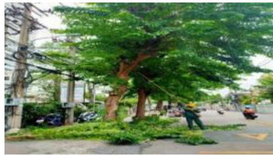
หลังดำเนินการ