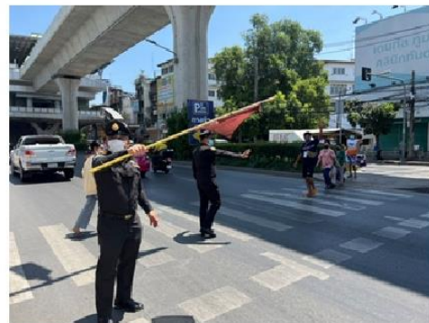
หลังดำเนินการ